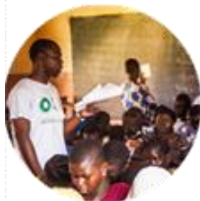
Actividad en Benín Pág.10