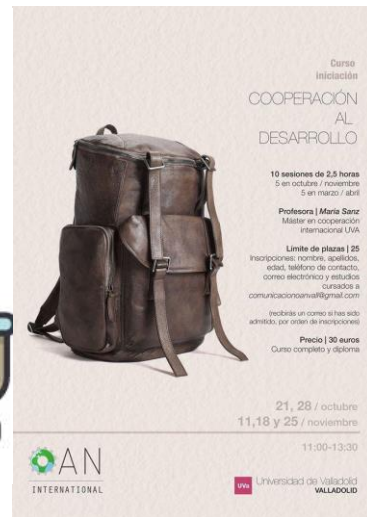
Curso iniciación: Cooperación al Desarrollo