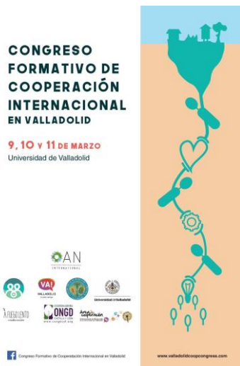
I Congreso Formativo de Cooperación Internacional