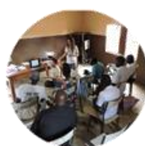
Balance 2017 Pág.16