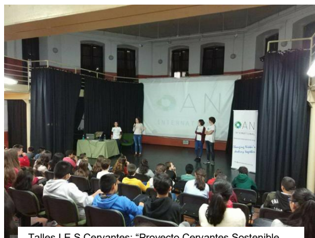
Talles I.E.S Cervantes: "Proyecto Cervantes Sostenible"