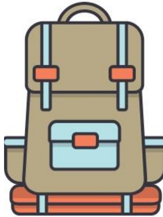
Talleres Colegio Santo Domingo de Guzmán