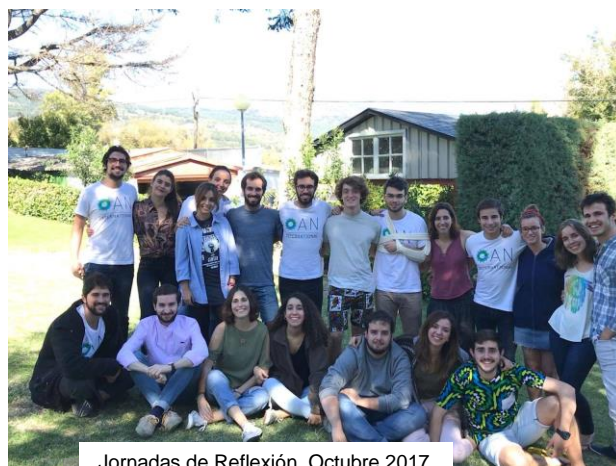
Jornadas de Reflexión. Octubre 2017