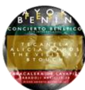
Actividad en Madrid Pág.15