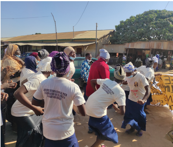
Algunas fotos de la celebración de la jornada del 25 de Noviembre de 2021:

La coordinadora del Comité de Políticas Sociales de una ONG beninesa explica cómo un grupo de mujeres de Nikki, una pequeña comunidad del sureste del país africano, enfrentan la violencia de género y reivindican su derecho a una vida en paz