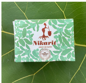
JABÓN SÓLIDO 130 g