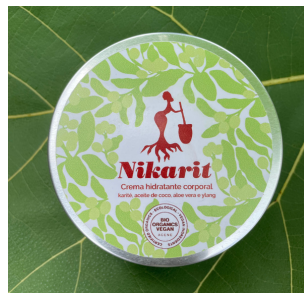
CREMA CORPORAL 15 ml