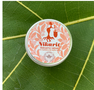
BÁLSAMO LABIAL 15 ml