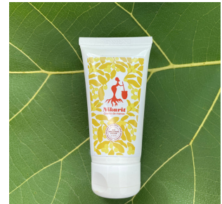
CREMA DE MANOS 50 ml