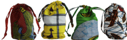
BOLSITAS TELA WAX HECHAS EN NIKKI 24 x 17 cm