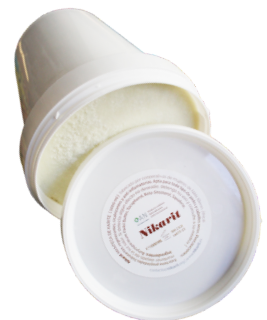
MANTECA DE KARITÉ PURA 100 ml