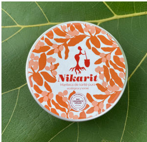
MANTECA DE KARITÉ PURA 100 ml